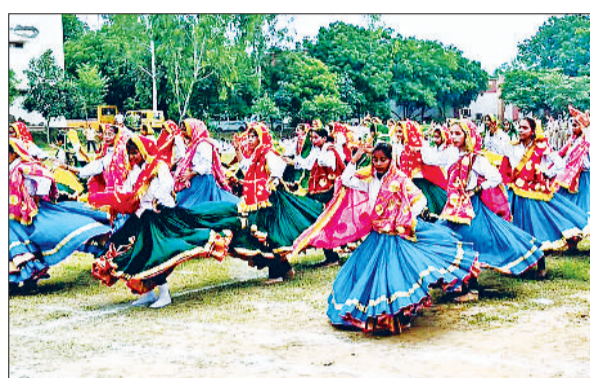
जीद। स्वतंत्रता दिवस समारोह को लेकर फुल ड्रेस में रिहर्सल करते हुए बच्चे।