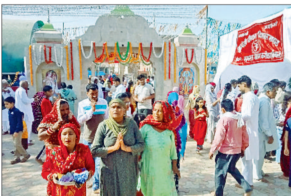
पाई। करोडा गांव में दादी सती स्थल पर मेले में पहुंचे श्रद्धालु