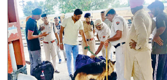
जींद। रेलवे जंक्शन पर सर्व अभियान चलाए पुलिसकर्मी।