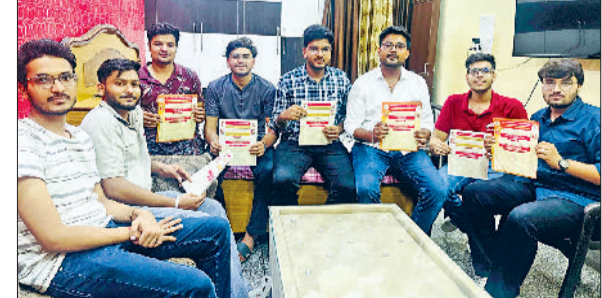
जीद। परिचय सम्मेलन को लेकर चर्चा करते युवा।