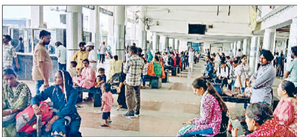
जीद। बस का इंतजार करते हुए यात्री।

फरीदाबाद में गुरुवार को प्रदेशस्तरीय विभाजन विभीषिका कार्यक्रम आयोजित किया जा रहा है। कार्यक्रम के लिए प्रदेशभर से रोडवेज की 470 बसें जाएंगी। परिवहन विभाग के निदेशक ने सभी रोडवेज महाप्रबंधकों को पत्र जारी कर बसों की व्यवस्था सुनिश्चित करवाने के निर्देश दिए हैं। चलते गुरुवार को यात्रियों को सुविधा का सामना करना पड़ सकता है। प्रत्येक डिपो से बसों के अलावा प्राइवेट वाहन फरीदाबाद जाएंगे/विभाजन विभीषिका कार्यक्रम आयोजन