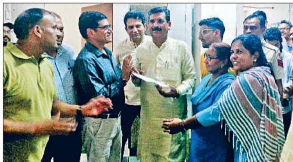
जींद। मांगों को लेकर कैबिनेट मंत्री को ज्ञापन सौंपते हुए।