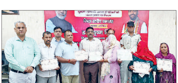
जींद। लाभार्थियों को प्रमाण पत्र वितरित करते डीसी।