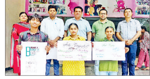
जीद। कार्यक्रम में भाग लेते विद्यार्थी।

उचाना। माजपा विधायक देवेन्द्र चतरभुज अजी ने राहुल गांधी और इंडी गठबंधन पर जम कर हमला बोला। अजी ने कहा कि राहुल गांधी और इंडी गठबंधन देश विरोधी ताकतों के दबाव में लोकतंत्र को बदनम कर रहे हैं। पहले देश को बदनम किया और अब चुनाव आयोग को बदनम कर रहे हैं। इतना ही नहीं सुप्रीम कोर्ट को बदनम किया केग को बदनम किया, सेना के सम्मान के साथ खिलवाड़ किया, सेना के शौर पर खाल खड़े किए। ये लोग लोकतंत्र की ध्वज उड़ा रहे हैं वो संवैधानिक संस्थाओं की मर्यादाओं के साथ खिलवाड़ कर रहे हैं वो देश में अराजकता फैलाना चाहते हैं। विधायक ने कहा कि राहुल गांधी बार बार झूठ बोल रहे हैं। पहले ऑपरेशन सिद्ध पर झूठ बोला और जब सेना ने सारे लख सामने रखे तो उनकी बोलती बंद हो गई। उन्होंने इंडीएम पर सवाल उठाए कि इंडीएम के कारण तो चुनाव हारते हैं, सबूत मांगे तो सबूत नहीं दिए। बाद में सुप्रीम कोर्ट ने फटकार लगाई तो राहुल गांधी रणखेड़वास हो गए। अब इंडीएम छोड़ दिया और एसआईआर पर आ गए हैं।