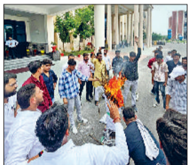
गेट के बाहर पुतला फूंकते हुए छात्र।