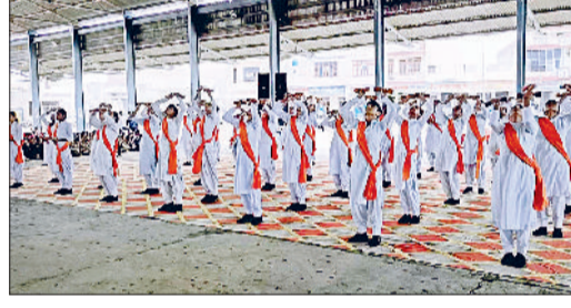
उचाना। सांस्कृतिक कार्यक्रम की प्रस्तुति देते प्रतिभागी।