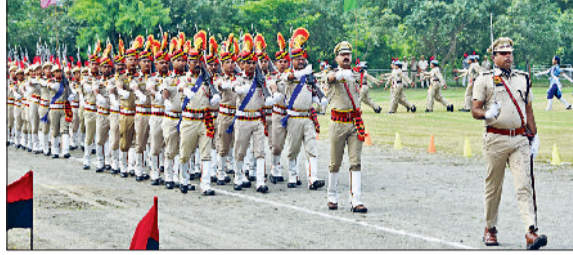
कैथल। परेड करते पुलिस के जवान व सांस्कृतिक कार्यक्रम प्रस्तुत करते विद्यार्थी