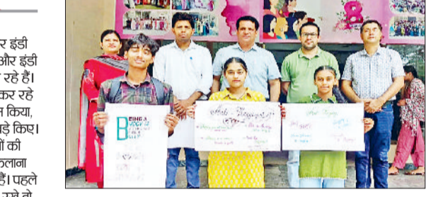
जीद। कार्यक्रम में भाग लेते विद्यार्थी।