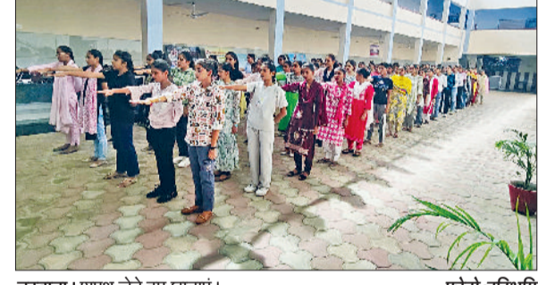
नरवाना। शपथ लेते हुए छात्राएं।

जीद। राजकीय कालेज में नशा मुक्त भारत अभियान (एनएमबीए) के अंतर्गत जागरूकता कार्यक्रम का आयोजन किया। कार्यक्रम कालेज के सभी स्टाफ सदस्यों, विद्यार्थियों, एनसीसी एवं एनएसएस इकाइयों की सक्रिय भागीदारी के साथ सफलतापूर्वक संपन्न हुआ। कार्यक्रम का शुभारंभ शायध राघव समारोह से हुआ। जिसमें उपस्थित सभी प्रतिभागियों ने नशा मुक्त समाज के निर्माण के लिए शपथ ली। इसके पश्चात नशा मुक्त जागरूकता रैली का आयोजन किया गया। जिसमें विद्यार्थियों ने नशा विरोधी संदेशों के साथ कालेज परिसर और आसपास के क्षेत्र में जन जागरूकता का संदेश फैलाया। प्राचार्य सरवजन ने प्रेरणादायक संबोधन में कहा कि नशा बुद्धि को विकृत करता है, भावनाओं को क्षीण करता है और विवेक को धीरे धीरे समाप्त कर देता है। युवाओं को समझना होगा कि थोड़े समय की उत्तेजन के लिए किया गया है समझौता, जीवनमर बुद्धिपूर्व संवेधाने और अंतर्विदेक से वंचित कर देता है।